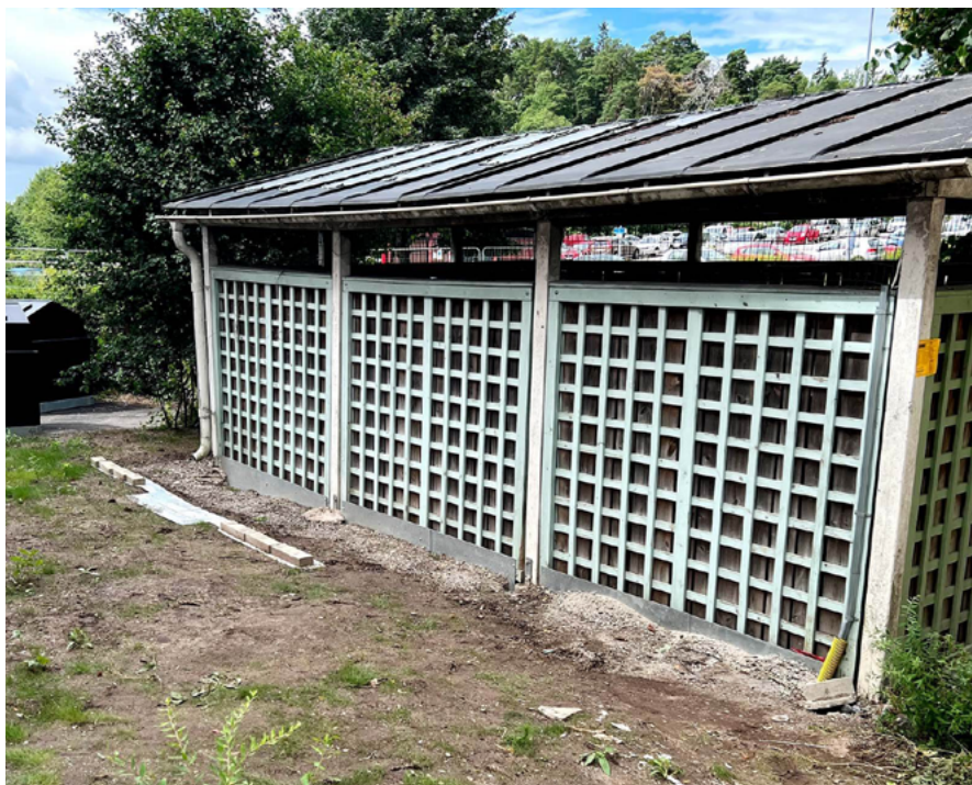
Renoverad miljöstuga på Skvadronsvägen.