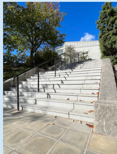
Färdiga trappan efter omgestaltningen.

Trappan i Helenelunds centrum har fått ett ny gestaltning. Under sommaren har arbetet med trappan genomförts och nu är det helt klart.