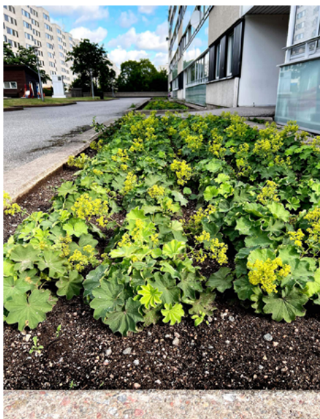
Nya rabatter på Malmvägen.