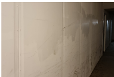
Ommålad korridor - före