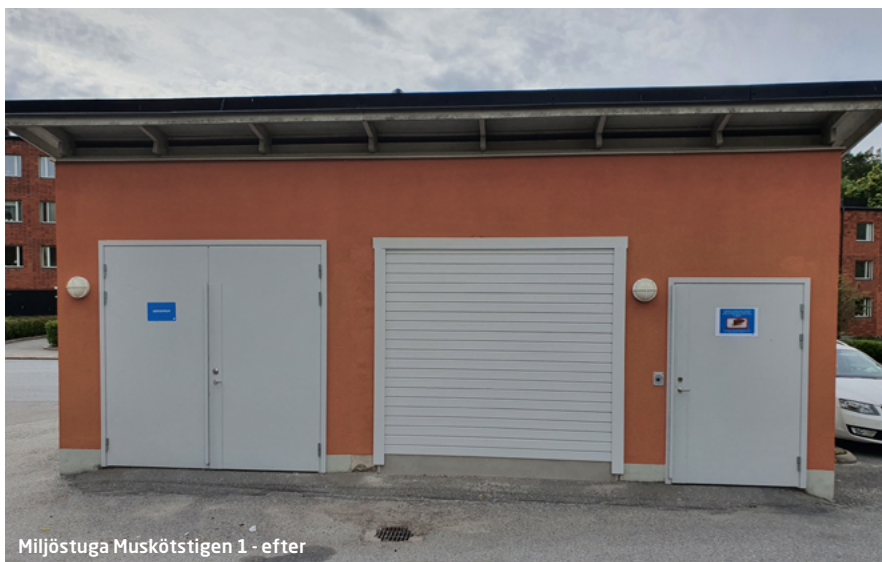
Miljöstuga Muskötstigen 1 - efter