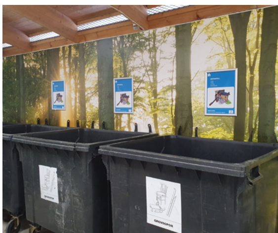
Miljöstuga Muskötstigen 1 - efter