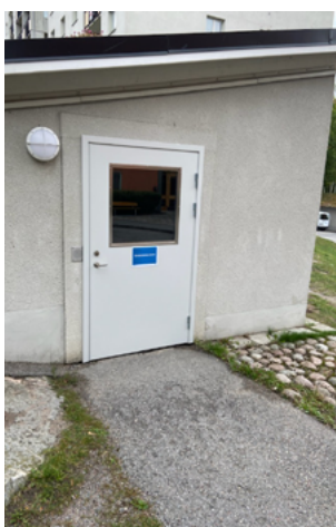
Miljöstuga Muskötstigen 1 - före