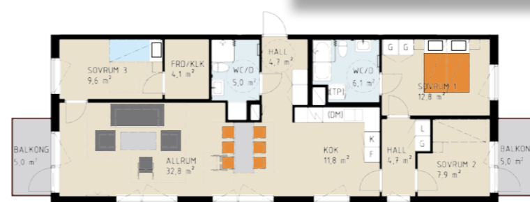
Unik fyrrummare med dubbla balkonger, två badrum och smarta förvaringslösningar.