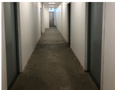
Ommålad korridor - efter