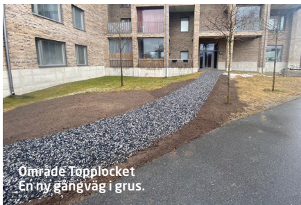
Område Topplocket En ny gångväg i grus.