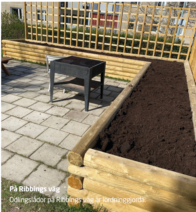
På Ribbings väg Odlingslådor på Ribbings väg är iordninggjorda.