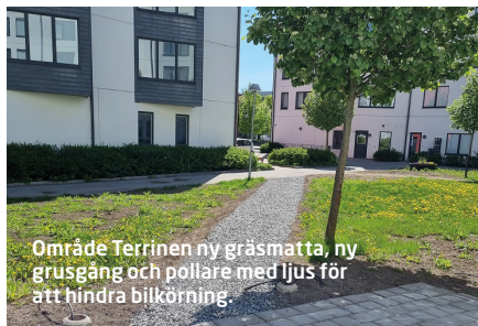
Område Terrinen ny gräsmatta, ny grusgång och pollare med ljus för att hindra bilkörning.