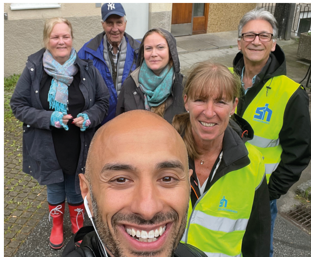
Skyttevägen, Jaktstigen och Ribbings väg Fönsterbyten blir klara i augusti. Trygghetsvandring på Skyttevägen i samarbete med Hyresgästföreningen