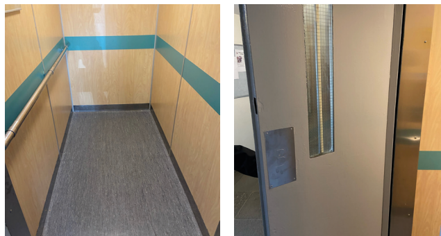
På Muskötstigen 5 Nya hissarna är klara! Vi har renoverat hissarna med nya golvmattor, och nymålade hissdörrar.