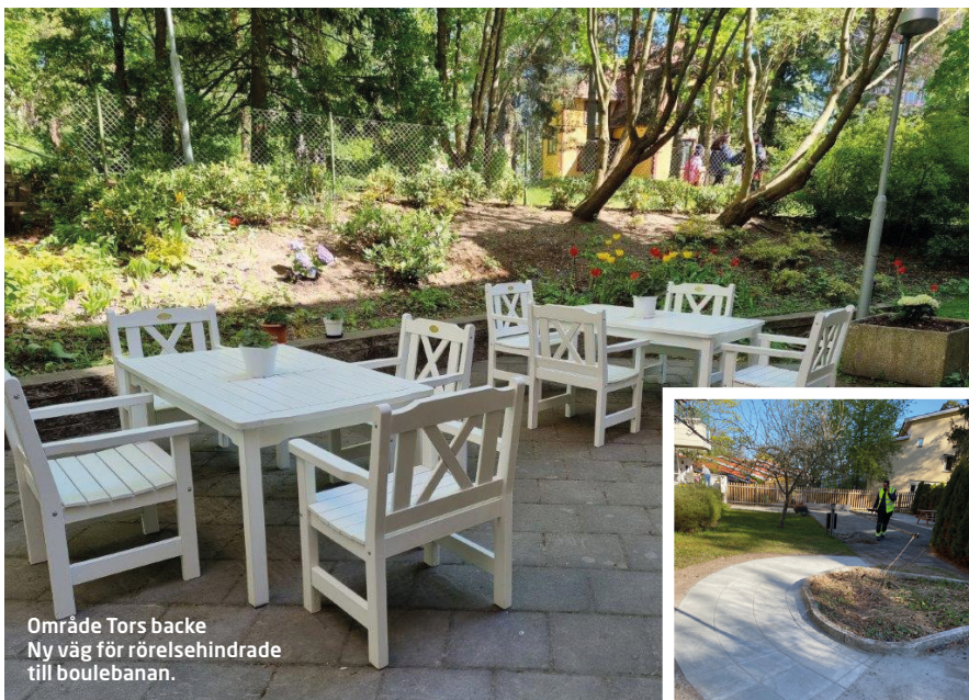
Område Tors backe Ny väg för rörelsehindrade till boulevanen.